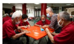
繪本行動員 - 社區巡陪伴長者

我們將活動整理成系列包羅，集結各場精彩內容與您分享！也歡迎分享給更多朋友，一起看見熟齡工作者在職場扮演重要角色，促進不同世代學習與合作，讓社會一起越老活越好！