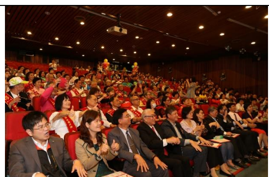
與會貴賓、得獎志工與觀禮夥伴