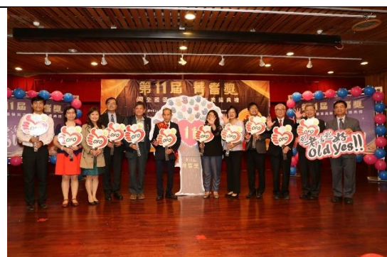
貴賓與耆耆獎代表啟動儀式