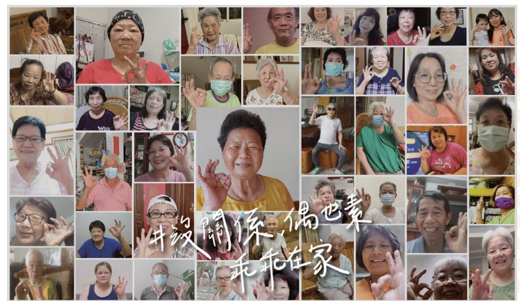
OFO 財團法人老五老基金會