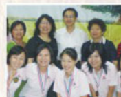
▲董事們與資深敬業獎得主合影。

老五老基金會過去十年是一個階段性任務的達成，同時也是下個階段的開始，活動當天，藉由拼台灣地圖的儀式，一同許下未來十年的願景——「有老人的地方，就有老五老」，希望版圖能拓及到全台，為更多的老人服務。