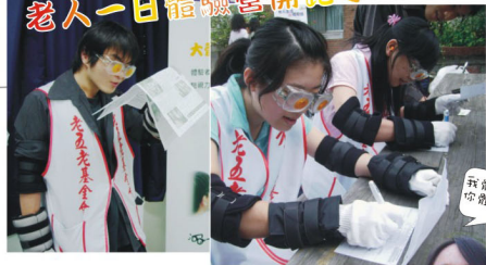
我體驗過了 你體驗了沒?

老人不該被視為一個問題，也不是沈重的負擔，「老」是每個人必經的過程，每個人都會變老，關心今天的老人就是關心未來的自己，因此應該從觀念著手，對「老」有重新的認識與體驗。本會基於老吾老以及人之老之理想，越老活得越好的遠景，希望在高齡化的社會裡，消除對老人負面的刻板印象，肯定老人之價值，透過老人模擬體驗，讓更多人可以體驗老化所造成的不方便，對老人多一點耐心、多一點關心，以維護老人尊嚴，塑造一個對老人友善的環境。