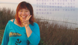
在參與時，生活就充實了！大家參加活動的價值可貴；參與過程中，享受及分享，對長者來說，是志工服務對長者最珍貴的禮物。也請志工們繼續努力服務長者，持續參與活動，繼續為長者服務。