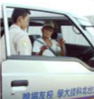
▲復康巴士接送彰化日間照顧老人的情形。