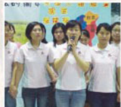
▲本會游藝裡執行長帶領全員一同感謝大家對基金會這十年來的支持。